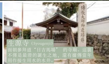
生源寺 (Syougenji) 面朝參拜道“日吉馬場”的寺廟。這裏不僅是最澄的誕生之地，還有據傳當年用作接生用水的水井。