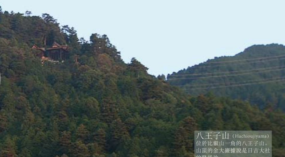
八王子山 (Hachiojiyama) 位於比叡山一角的八王子山。 山頂的金大巖據說是日吉大社 的發祥地。