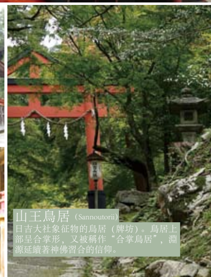
山王鳥居 (Sannoutorii) 日吉大社象征物的鳥居 (牌坊)。鳥居上部呈合掌形，又被稱作“合掌鳥居”，淵源延續著神佛習合的信仰。