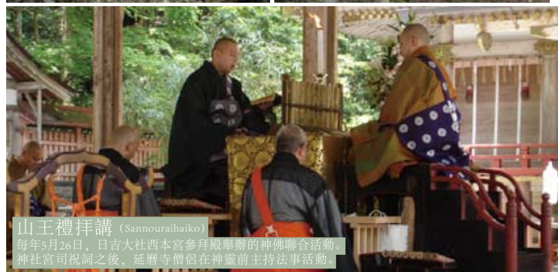
山王禮拜講 (Sannourahaiko) 每年5月26日，日吉大社西本宮參拜殿舉辦的神佛聯合活動。 神社官司祝詞之後，延曆寺僧侶在神靈前主持法事活動。