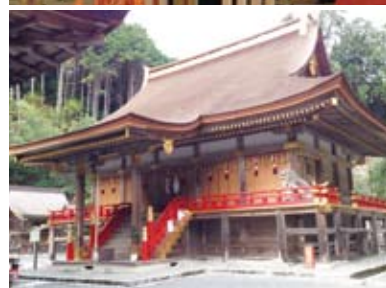
下殿 (Geden) 日吉大社和延曆寺關係緊密的時代，本殿下建有被稱作下殿的房間，據傳不僅祭拜佛像和佛畫，還有僧侶在這裏舉辦佛事。