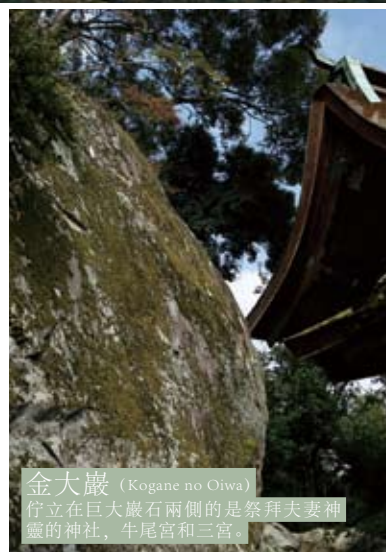
金大巖 (Kogane no Oiwa) 佇立在巨大巖石兩側的是祭拜夫妻神靈的神社，牛尾宮和三宮。

距今約150年前，明治政府發布的神佛分離令，為延續千年的神佛習合歷史畫上了句號。然而今天我們仍然可以在日本各地看到寺廟和神社的混在，不禁令人緬懷起神佛習合的殘影。比叡山坂本也是同樣，從延曆寺的回峰行到日吉大社的節慶活動乃至建築物等，神佛習合根深蒂固延續至今。