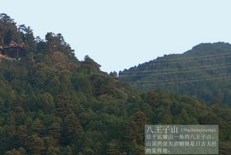
八王子山 (Hachiojiyama) 位于比睿山一角的八王子山。山顶的金大岩据说是日吉大社的发祥地。