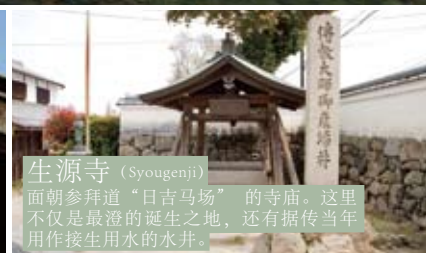
生源寺 (Syougenji) 面朝参拜道“日吉马场”的寺庙。这里不仅是最澄的诞生之地，还有据传当年用作接生用水的水井。