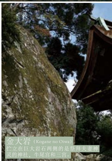
金大岩 (Kogane no Oiwa) 伫立在巨大岩石两侧的是祭拜夫妻神灵的神社，牛尾宫和三宫。

距今约150年前，明治政府发布的神佛分离令，为延续千年的神佛习合历史画上了句号。然而今天我们仍然可以在日本各地看到寺庙和神社的混在，不禁令人缅怀起神佛习合的残影。比睿山坂本也是同样，从延历寺的回峰行到日吉大社的节庆活动乃至建筑物等，神佛习合根深蒂固地延续至今。