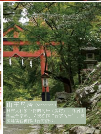
山王鸟居 (Sannoutorii) 日吉大社象征物的鸟居（牌坊）。鸟居上部呈合掌形，又被称作“合掌鸟居”，渊源延续着神佛习合的信仰。