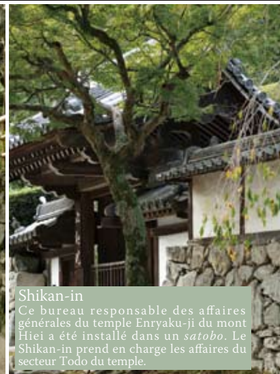
Shikan-in Ce bureau responsable des affaires générales du temple Enryaku-ji du mont Hiei a été installé dans un satobo . Le Shikan-in prend en charge les affaires du secteur Todo du temple.