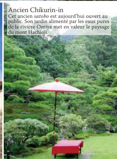
Ancien Chikurin-in Cet ancien satobo est aujourd'hui ouvert au public. Son jardin alimenté par les eaux pures de la rivière Omiya met en valeur le paysage du mont Hachioji.