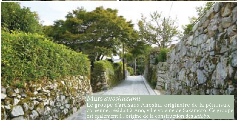
Murs anoshuzumi Le groupe d'artisans Anoshu, originaire de la péninsule coréenne, résidait à Ano, ville voisine de Sakamoto. Ce groupe est également à l'origine de la construction des satobo .