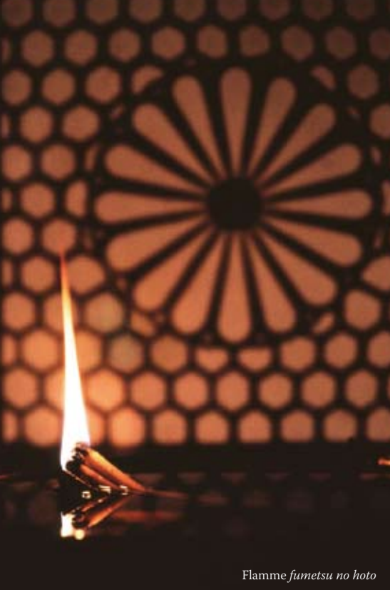
Flamme fumetsu no hoto