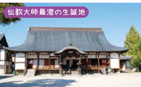
伝教大師最澄の生誕地

関西の日光とも呼ばれています。また高台の境内からは四季折々の樹木と琵琶湖が望めます。