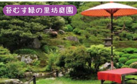
苔むす緑の里坊庭園

レトロな雰囲気駅の駅舎は、大正14(1925)年築の洋風木造2階建てで国の登録有形文化財となっています。