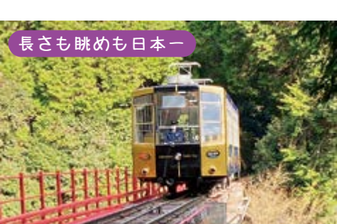
長さも眺めも日本一