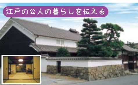
江戸の公人の暮らしを伝える

主屋の置かれた座卓に映り込んだ庭を写すリフレクション撮影が最近SNSで人気を集めています。