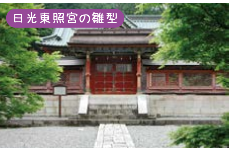
日光東照宮の雛型