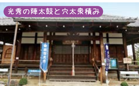
光秀の陣太鼓と穴太衆積み

隣の慈眼堂は天海大僧正の廟所で、江戸時代以降の歴代天台座主の墓や徳川家康や紫式部の供養塔もあります。