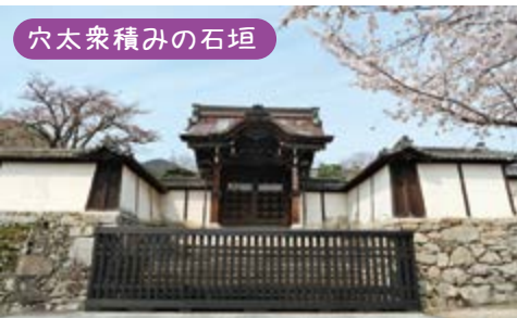
穴太衆積みの石垣