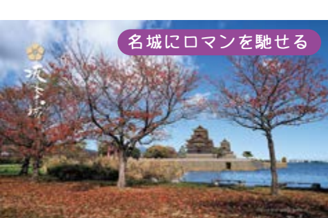
名城にロマンを馳せる